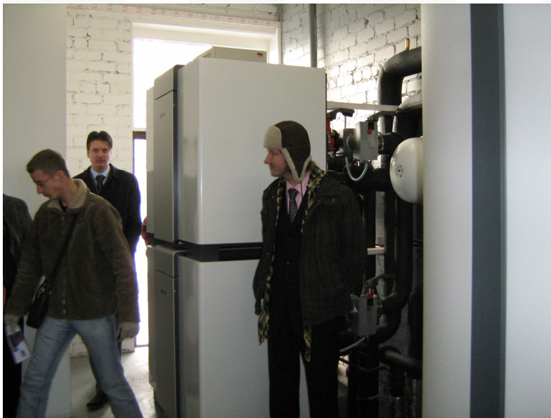
Divi siltumsūkņu bloki ar 70 kW siltuma ražību katram, kas uzstādīti Skaistkalnes vidusskolā

enerģiju ilgstošā laika posmā. Siltumsūkņu kalpošanas laiks bez atsevišķu daļu nomaiņas sasniedz 30-40 gadus. Siltumsūkņi tiek uzstādīti kopā ar karstā ūdens akumulācijas tvertnēm. Sistēma aprīkota ar automatizācijas iekārtām un strādā automātiskā režīmā. Sistēmas vadību un kontroli var nodrošināt arī attālināti no pults, kas ir mobilā telefona lielumā.